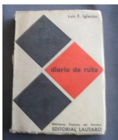
Fotografía de la tapa del libro "Diario de ruta" del pedagogo Luis F. Iglesias